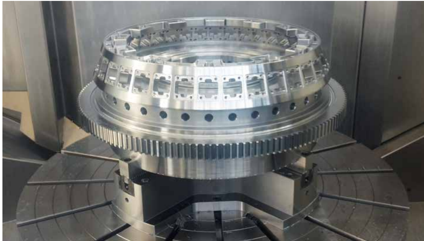
HWR InoFlex® VL070 auf Reiden RX12

bewegen sich alle Bauteile, die für den Antrieb zuständig sind (z.B. Keilstange, Keilhaken, Planspirale), gleichzeitig und gleichmässig auf das Zentrum zu oder vom Zentrum weg.