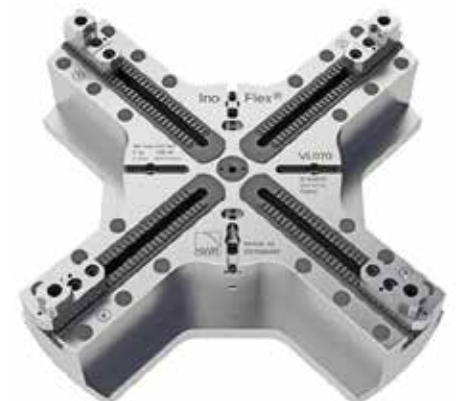
InoFlex® VL070 – das universelle Spannmittel für grosse Dreh-/Fräszentren

In einem herkömmlichen 4-Backen-Futter resp. Spanner